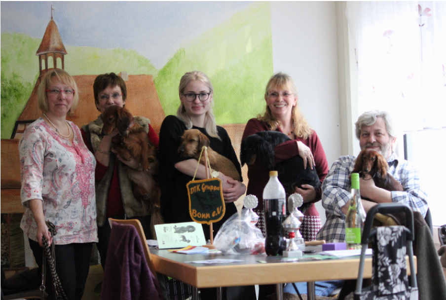
Die erfolgreichen Aussteller der Gruppen Bonn, Köln und Dortmund bei der Spezialausstellung der Gruppe Dierdorf